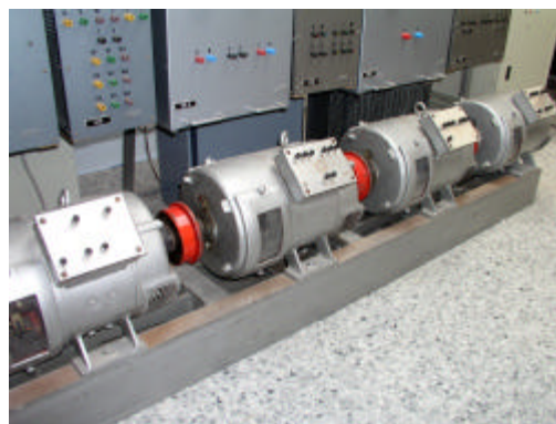
Figura 3. Diseño de Laboratorios

Este diseño no sólo debe facilitar la realización segura de las prácticas (por ejemplo con el uso de equipos especialmente adaptados a las tareas de enseñanza-aprendizaje, la reducción de la distancia entre las conexiones, etc.), sino que debe permitir la permanencia y el tránsito de los individuos entre los grupos, evitando la invasión de estos lugares de paso con herramientas, equipos, cables, etc.